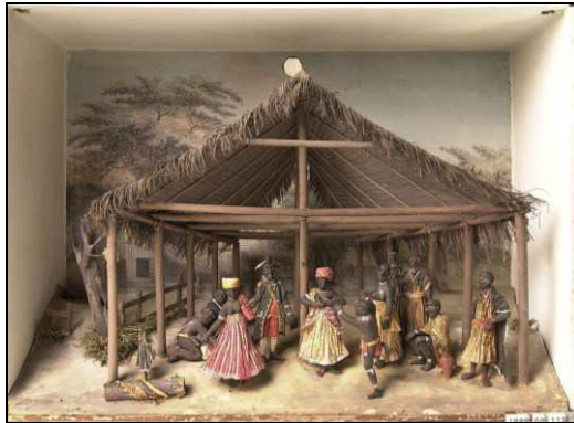
↑ Diorama 'Boschnegerfeest in de kolonie Suriname' door Gerrit Schouten 1835 (collectie Museum Bronbeek)

Dansers brengen in een route langs verschillende periodes van de koloniale geschiedenis elementen van opstand en onrust naar voren.