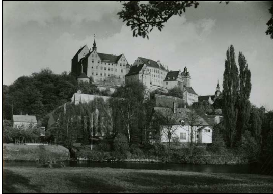
↑ Slot Colditz ten zuiden van Leipzig

Loop mee met een gids door twee tijdelijke tentoonstellingen.