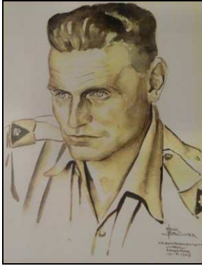
↑ Luitenant Simon van Schie, aquarel door Henk Brouwer, 1943 (collectie Museum Bronbeek)

Loop mee met een gids door twee tijdelijke tentoonstellingen