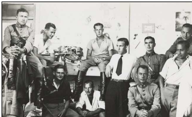
↑ Jonge KNIL-cadetten van de Koninklijke Militaire Academie en een stoker (midden met strotdas) van de Koninklijke Marine in gevangenschap in Duitsland op hun slaapzaal, allen geboren in Nederlands-Indië. (collectie Nederlands Instituut voor Militaire Historie).

Voor het eerst wordt een tentoonstelling gewijd aan de Nederlandse 'erewoordweigeraars' in de Tweede Wereldoorlog, in het bijzonder hen die afkomstig waren uit Nederlands-Indië: de katjongs . Wie waren zij, hoe brachten zij hun dagen door, op welke manieren trachtten zij te ontsnappen, en wie lukte dat?