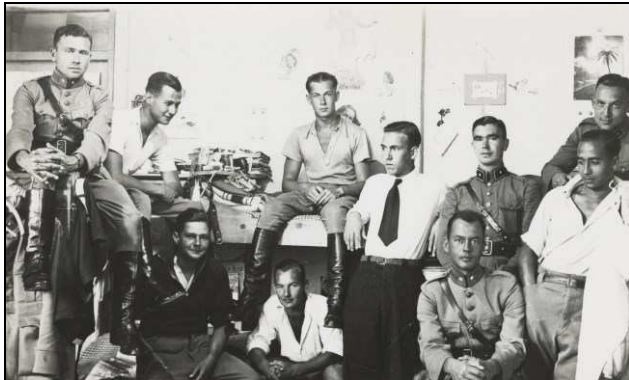
↑ Jonge KNIL-cadetets van de Koninklijke Militaire Academie en een stoker (midden met stropdas) van de Koninklijke Marine in gevangenschap in Duitsland op hun slaapzaal, allen geboren in Nederlands-Indië.